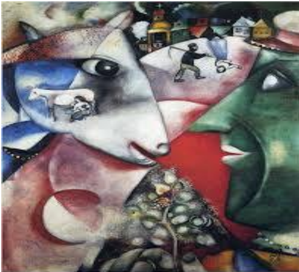
“Yo y mi aldea”. (1911) Marc Chagall

Trabajaremos una vez más con la obra de Marc y ustedes, con la ayuda de su familia van a observar y conversar lo que ven en esta obra. En este caso solicito al adulto que los acompaña, escriba a mano la descripción de esta obra, de lo que van diciendo ustedes.