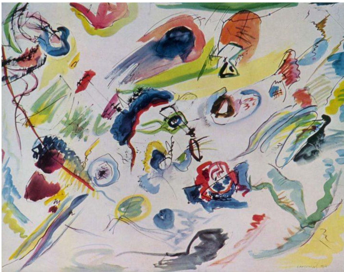
Primera acuarela abstracta. Kandinsky. 1910

Hola, chicos. Los saludo desde casa, con esta particular forma en que estamos aprendiendo. Seguiremos trabajando con nuestro amigo ruso: Vasili Kandinski , una persona muy interesante que fue profesor, artista y teórico de arte. Fue autor de la primer obra abstracta, acá abajo se las presento: