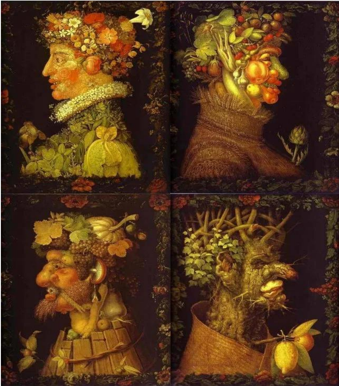
Las cuatro estaciones. Giuseppe Arcimboldo